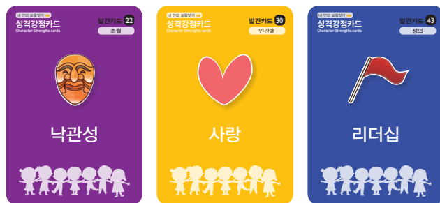
나의 특성이 잘 나타난 강점 고르기