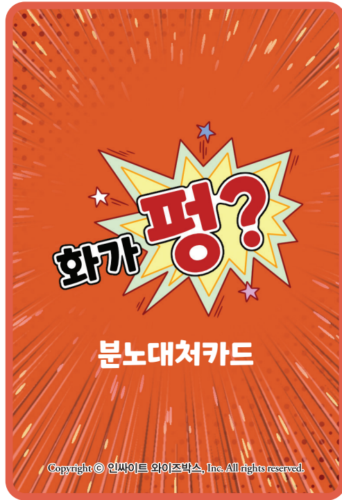
분노카드 + 특수카드