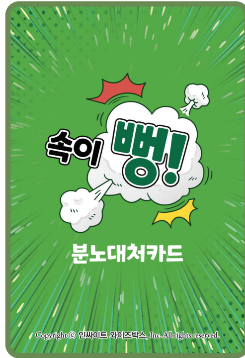
대처카드 + 감정카드