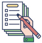
쓰기 성취 검사