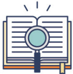
읽기 성취 검사